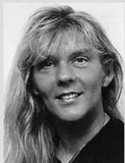
Anzeigenmarketing diy-Fachmagazin DIY International HOLZFORUM Garten & Lifestyle (PLZ 3-5)