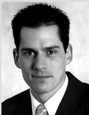
Anzeigenmarketing diy-Fachmagazin DIY International HOLZFORUM Garten & Lifestyle (PLZ 0-2, 6-9)

Simone de Lorenzi s.delorenzi@daehne.de, (-107)